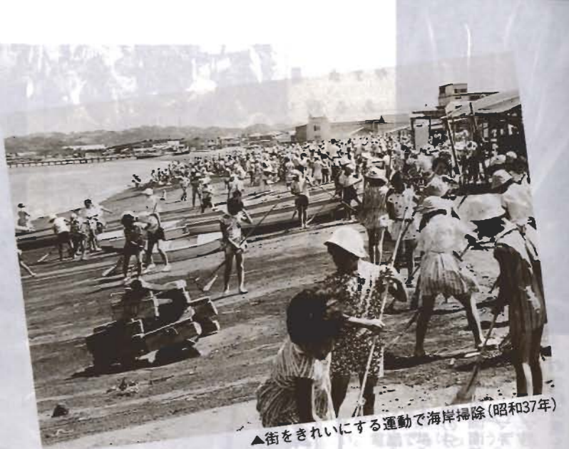
▲街をきれいにする運動で海岸掃除(昭和37年)