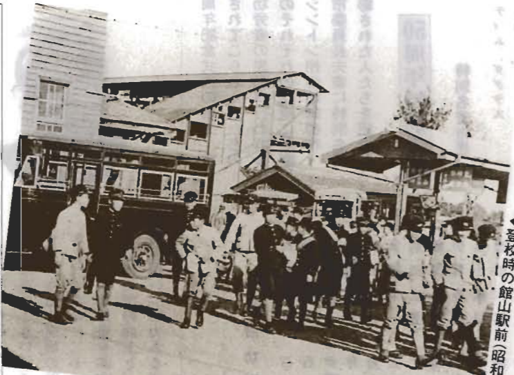
▲登校時の館山駅前(昭和14年)