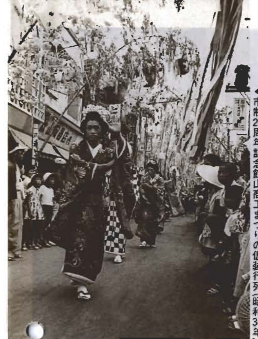
▲市制20周年記念館山商工まつりの仮装行列(昭和34年)