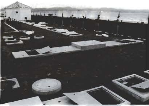
三軒町生活排水処理施設

バーベナ・テネラ さしあげます 「まち中を花の香りといっぱいにしたい」と願う、市では、市民のみならずといっしょになり、「花のまちづくり運動」をすすめています。 あなたのご家庭でも、この運動に参加しませんか。希望者に「バーベナ・テネラ(和名「姫美子桜」)を無料で差しあげます。 申し込みは、市教育委員会社会文化課(☎二二二二二二)内線二〇六)へ、どうぞ。 【育て方】 ブラジル南部の原産のため、寒さには少し弱いですが、夏の暑さと乾燥に強く、少しくらい