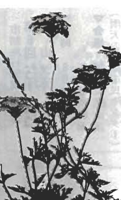
一花の輪を まちに、家庭に、心にも

「まち中を花の香りといっぱいにしたい」と願う、市では、市民のみならずといっしょになり、「花のまちづくり運動」をすすめています。 あなたのご家庭でも、この運動に参加しませんか。希望者に「バーベナ・テネラ(和名「姫美子桜」)を無料で差しあげます。 申し込みは、市教育委員会社会文化課(☎二二二二二二)内線二〇六)へ、どうぞ。 【育て方】 ブラジル南部の原産のため、寒さには少し弱いですが、夏の暑さと乾燥に強く、少しくらい