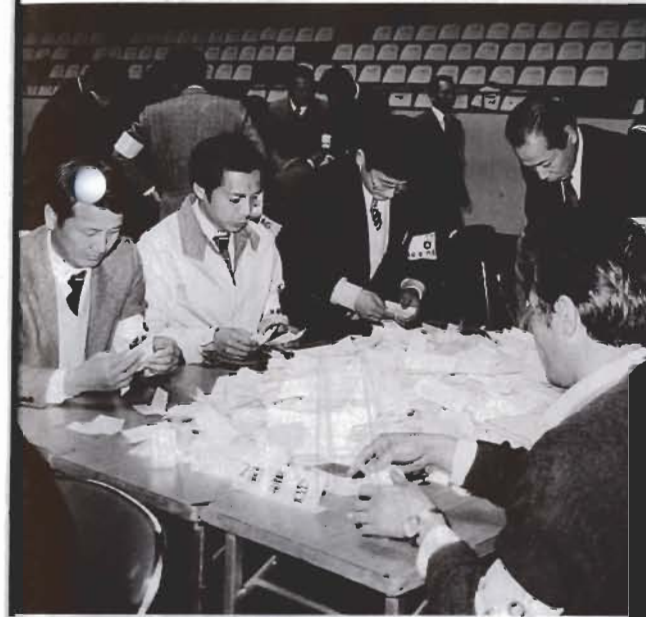
よく確かめて、しっかり投票を……