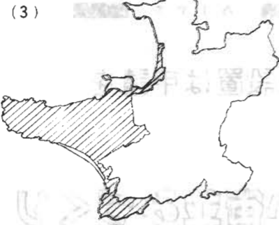
「重点整備地区予定区域」監視区域

那古・船形地区と北条地区の 一部に給水している三芳水道金 業団の水道料金も改定を予定し、 三月議会上程、審議をお願い することになっています。市水 道と同様に想定してみますと、 平均使用水量は二か月間で、三 十リットルです。現行料金は三千 九百四十円。改定後は四千五