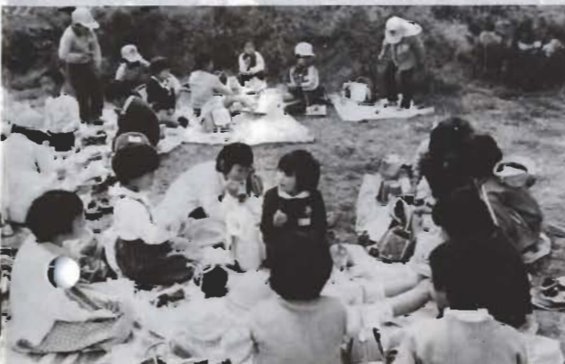
今も、八幡神社は遠足地に人気があります...

明治時代にはじまった近代教育の、大きな目的のひとつは、国民の志気を高めることにありました。そのため、知育、徳育とともに、体育が重んじられるようになったのです。 現在の館野小学校の前身である、現在の遠足のようです。校