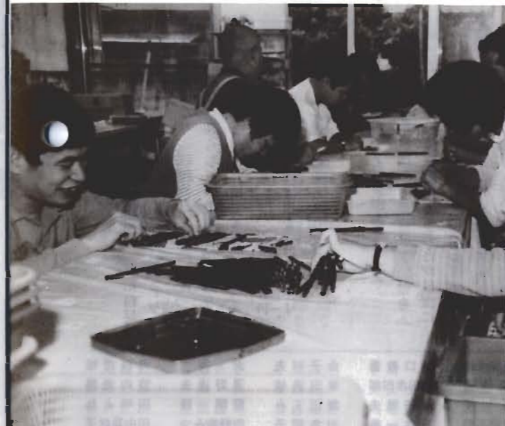
福祉作業所で、ボールペン組立て作業が進みます。

九月定例市議会で、行政一般について、六人の議員が質問に立ちました。痴呆性老人対策や、リゾート法指定の見直し、通学路の整備、文化会館の建設問題など、多彩な質問が出されました。主なものを紹介します。