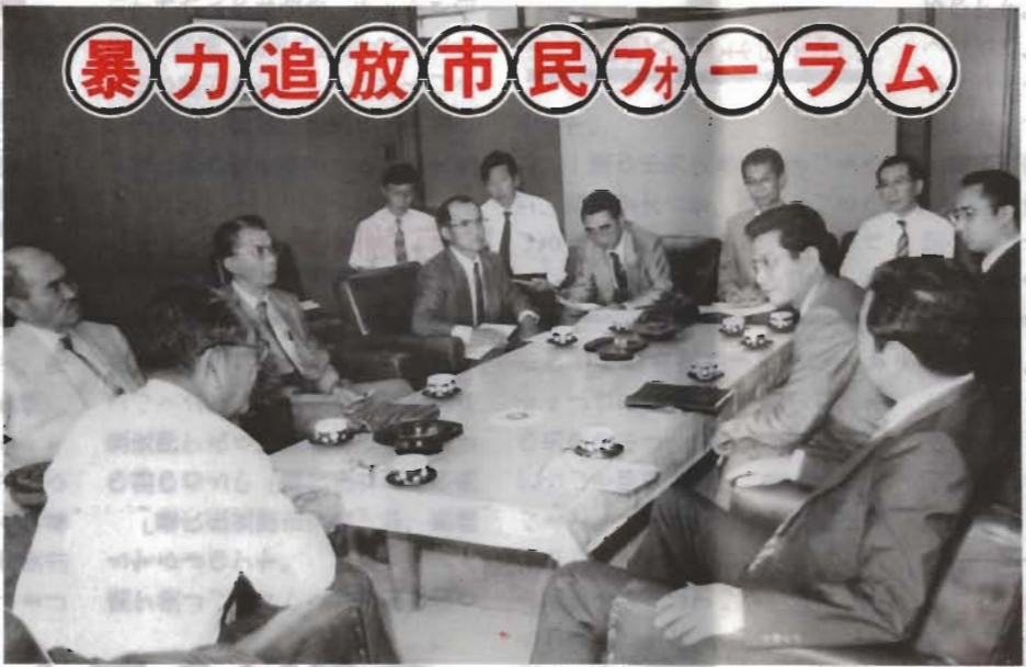
情報交換など真剣な討論をくりひろげる警察関係者・市長・防犯協会役員

署長 そういうことが言えますね。警察では、去年の暮れから、岸本組の壊滅を期して、頂上作戦を展開して、これまでに、県