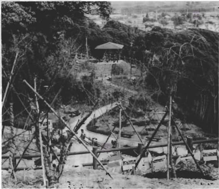
城山公園の梅園建設はまもなく完成します