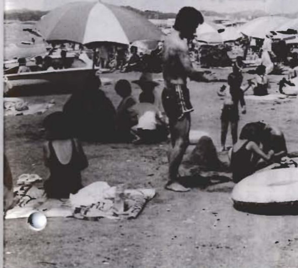
鏡ヶ浦は大切な海水浴場です

答え 県救急医療機関整備事業に繰り出すことにより、土地開発基金繰入金五千四百二十四万七千円、財政調整基金積立金三千九百九十九万九千九百九十九円、扶助人員が減ったことにより、生活保護費五千九百六十六万三千円。現在、船形漁協に建設中の製氷、貯氷庫の事業量の変更に伴う減額三千九百九十九万七千円。県道改良工事、館山港修築工事負担金で二十一万円。