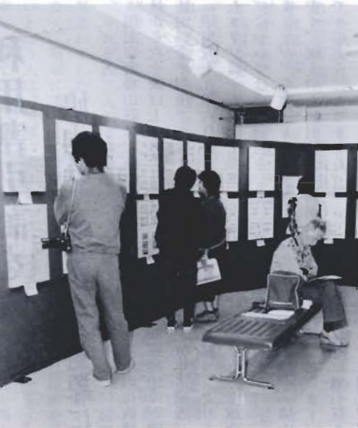
昨年の文化祭から

館山市文化祭で、本年度新しく「我が家のじまん展」を企画しました。 市民の皆さんに、これぞ我が家で自慢すべきものという収蔵品を提供していただき、一般市民が、より価値のある美術品を鑑賞できる機会を得ようとするものです。 今年は、十月二十五日(土)と二十六日(日)の二日間、コミュニティセンター展示室において、「美を探る」と題し、絵画、彫刻、書の展示を行います。皆さんの自慢の品の提供をお願いします。 収蔵品を提供していただける人は、十月一日から十五日まで