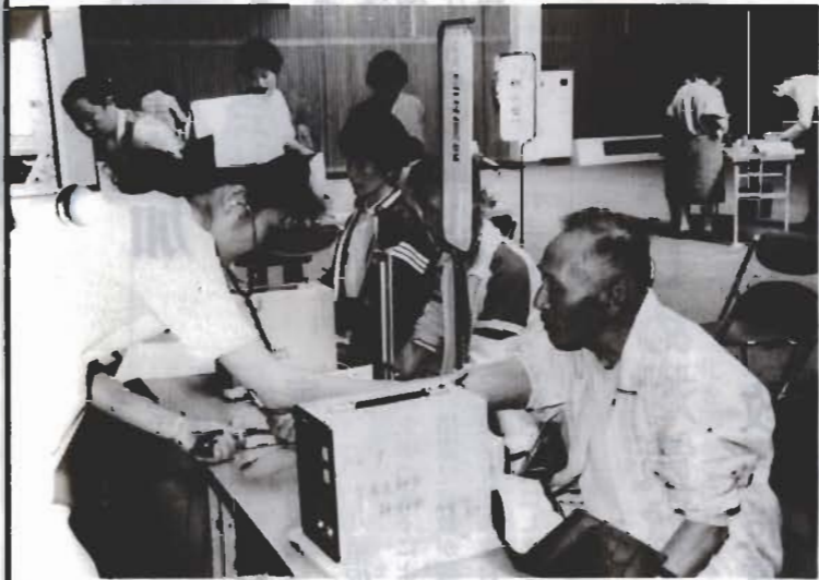
定期検診で医療費削減を...

今年度の国民健康保険税(国保)を、昨年度よりも1世帯あたり平均16.2%引き上げました。国保税は、医療費を基準にして算出しますので、医療費がふえればみなさんが負担する国保税にはね返ります。ふだんから健康に十分注意しましょう。