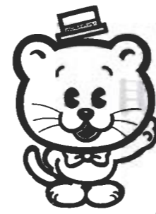
よく確かめて、しっかり投票を

管理委員会に問い合わせてください。投票の順序と、投票用紙を間違えないように気を付けてください。