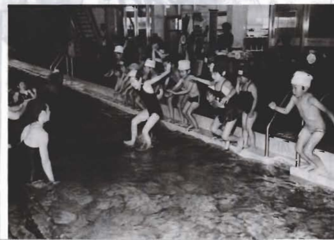
先月、市教育委員会主催の親子水泳教室と卓球教室が開かれました。

イキな着物姿に、軽妙な舞。日ごろのけいこの成果が光るのは、先月18日に行われた、第6回船形地区芸能祭です。主催は、地区コミュニティ委員会。会場の船形小学校講堂で、幼稚園児の遊戯から、ご年輩のカラオケまで、それぞれが自慢の芸を披露すれば、800人の観客も大拍手。「がんばって」の声援もとびかい、地域の親睦がますます深まりました。