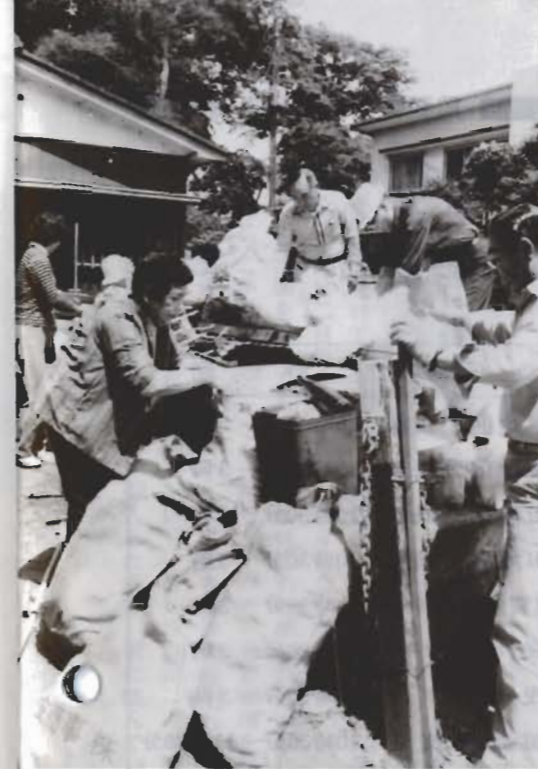
散乱ごみ一掃にご協力を

「ごみゼロの日」が近づきました。市はことしも、関東など一都九県の統一環境美化運動の日にあわせて、六月一日(日)を市内一斉清掃デーに決めました。散乱ごみの清掃を、各地区の町内会やコミュニティ委員会などを中心に、奉仕団体の協力のもと、市全域で実施する計画です。皆さんもご参加ください。