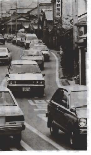
船形で交通渋滞はしばしば...