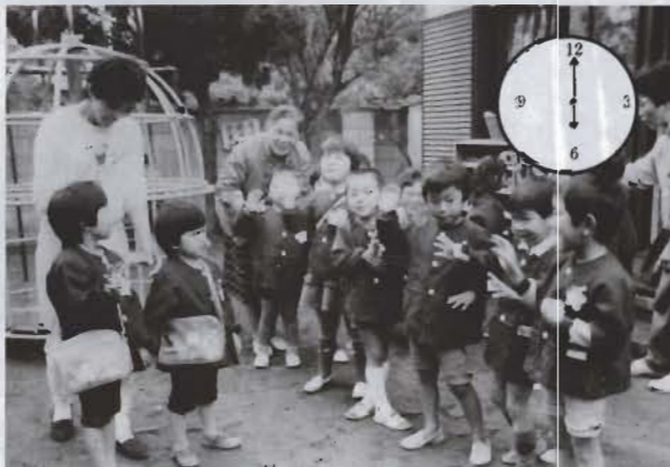
アンデレ保育園で

こうした一日の繰り返しの中で、月一回の職員会議や、必要に応じての集会を行い、時期にあった全体活動の検討や、長期計画を立て、園ごとの目標、予定など綿密な計画が練りあげられます。これらは、クラス・園だよりなどで家庭に知らされ、面接による個別指導も実施しています。