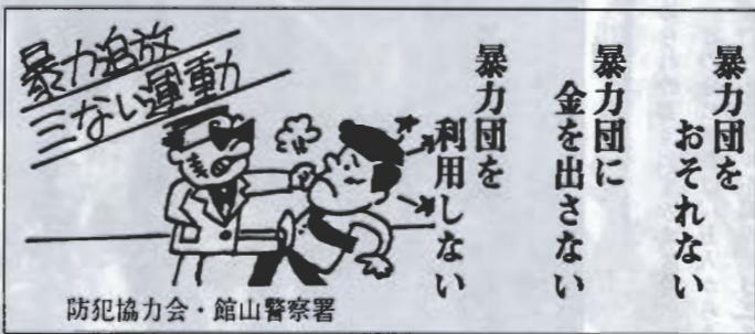
防犯協会・館山警察署