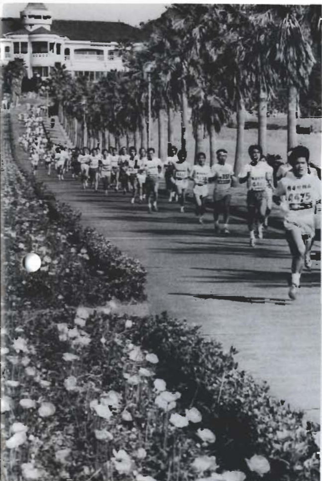
花の香いっぱいコースを走る選手 (第5回大会から)

競技内容 フルマラソンの部は十六歳から三十四歳、三十五歳から四十九歳、五十歳以上の男子と、十八歳以上の女子の四クラス。制限時間は五時間以内。十キロの部は十六歳から三十四歳、三十五歳から四十九歳、五十歳以上の男子と、十六歳以上の女子の四クラス。