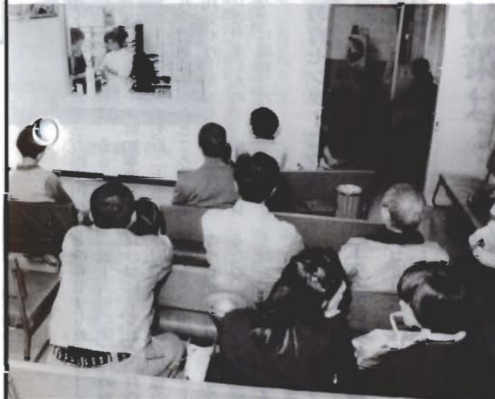
混み合う病院の待合風景

今年度の国民健康保険税(国保)を、昨年度よりも1世帯あたり平均17.2%引き上げました。国保税は、医療費を基準にして算出しますので、医療費がふえればみなさんが負担する国保税にはね返ります。ふだんから健康に十分注意しましょう。