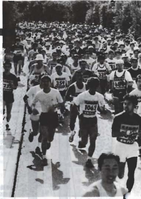
第五回若潮マラソンから