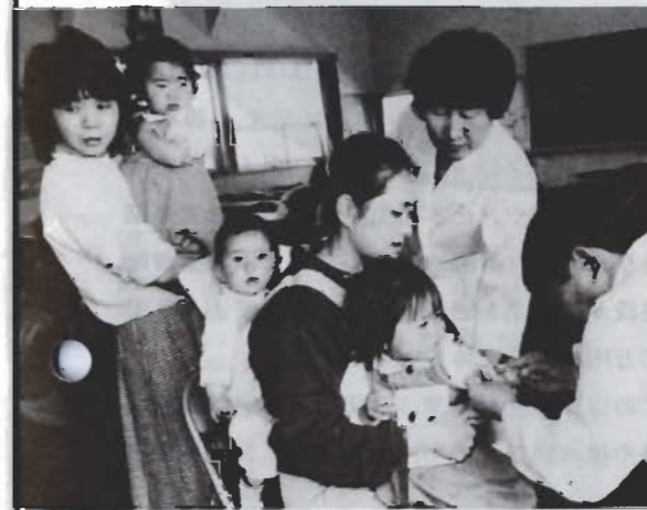
各種検診・予防接種の実施

在宅福祉を重点に、独居老人を対象とした災害防止器具の給付、入浴サービス事業を行います。高齢者生きがい対策として、就労相談事業を実施します。