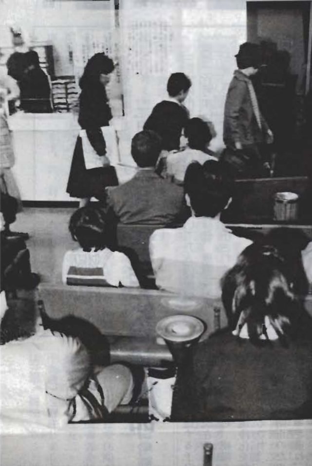
病院の待合室はいつもいっぱいです

国民宿舎/今年度は、利用客二万六千五百人を見込んで、収益的収入及び支出は、二億一千三百九十九万円です。