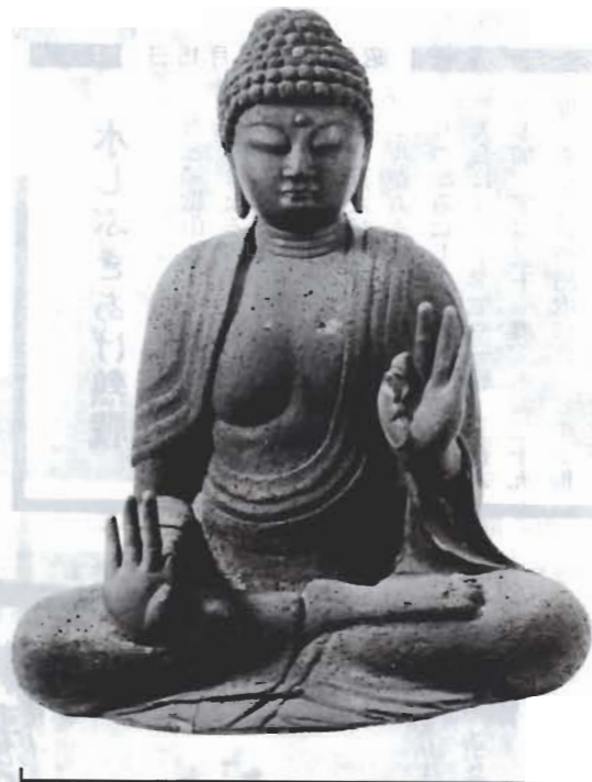
千祥寺で発見された木造如来坐像

神戸地区大神宮の千祥寺から平安時代中期のものと思われる仏像が見つかりました。 市立博物館が進めている、市内の文化財調査で発見されたもので、如来の姿をした木造の坐(ざ)像で、千祥寺の本堂に寺宝として安置されていました。像高七十二センチの一木造り。胸幅が厚くポリウム感があり、頭部は、こんもりもり上がっている肉髻(けい)と、地髪部の区別がはっきりしない古様を示しています。平安時代初期彫刻として有名な、京都にある神護寺の薬師如来立像(国玉)と共通した特徴をよく表わしています。 平安時代初期彫刻の特長が見