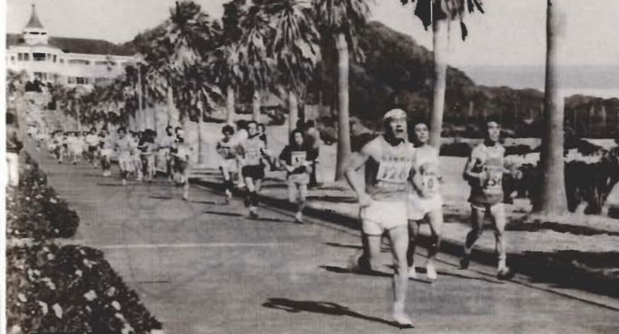
今年1月開催された第3回大会

恵まれた自然を生かして、「第四回若潮マラソン大会」を来年一月二十九日に行います。市民の体力づくりと、多くの人達に館山の素朴な人情、風土に親しんでもらおうと毎年実施しているものです。今回から高校男子の部も増やし、市民の多くの参加に期待しています。