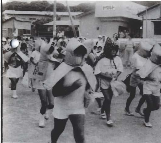
いざに備えて、日ごろから訓練が必要です(9月1日の館山地区防災訓練から)

問い 豊房育成牧場を安房郡畜産農業協同組合へ委託した後の施設管理費用負担やし尿処理