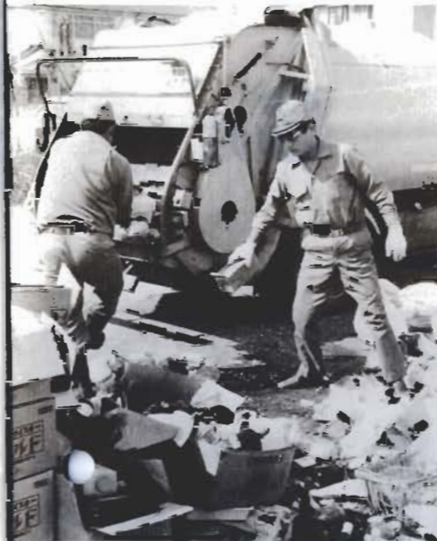
ごみ収集に忙しい毎日

これまでも、官報・県報のみならず、必要に応じて市広報、かいらんで知らせています。都市計画図なども、関係機関に配布するなど、周知に努めています。