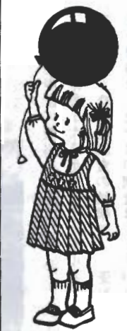
このページの お問い合わせは 市役所保健課へ

しめきり 九月二十六日(土)。注意 健康手帳のある人はお持ちください。検診日は個人あてにお知らせします。診断結果は、二週間ほどで出ますが、所見のある人だけに通知します。