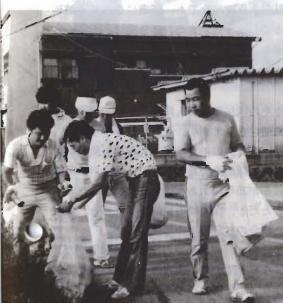
早朝から町内の清掃に汗を流す神明町青年会員

小学校、房南中学校の二会場で開催されました。写真。この大会は、ことしで二十六回め。地区をあげての、にぎやかな大会です。男子のソフトボールと女子のドッジボールを地区対抗戦で行い、小学生二人、中学生二人、一般六人で一チームを編成。親子三人で、ドッジボールに出場し、最後までがんばったチームもありました。また、お弁当を百人分用意して、大会にのぞんだ地区もありました。地元地区民の声援を背に選手は大奮闘、勝っても、負けても、みんな満足そうでした。