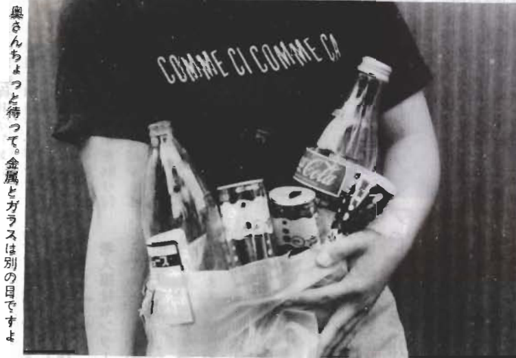
奥さんちよつと待つて。金属とガラスは別の目ですよ

六月から始めた不燃ごみの選別収集。金属とガラスに区別することは、よく知られているようですが、出す週の一部で混乱しています。十月と十一月のカレンダーで収集する週を表示しました。確認してください。