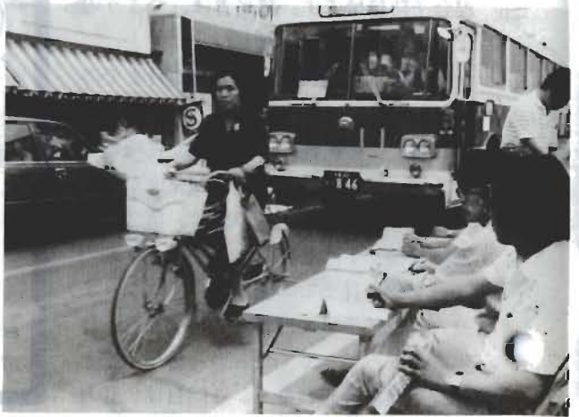
車種、方向などを詳しく調査しました

都市整備計画の資料にしよう と、都市開発室が六月九日(火) に実施した、交通量調査の結果 がまとまりました。この調査は 昨年十月に続いて二回目。国鉄 館山駅周辺の十か所で、朝七時 から夜七時まで、十二時間を調 べました。十か所のうち、十字 屋前(5、7)と南房通連前(8 、10)の三差路は三つずつに、 十字路(1、4)は四つに分け ましたので、表は十七の観測場 所になっています。