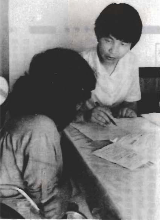
ことしは、国際障害者年。在宅身障者の実態調査は6月から9月まで行います