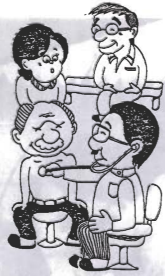
日ごろの健康管理も、国保税軽減に役立ちます。

今年度の国民健康保険税の税額が決まりました。平均税額は、一人あたり三万一千八百円。一世帯あたりでは八万六千八百円。昨年度に比べて一世帯平均九・九%の引き上げです。また、国保税の最高限度額も、二十四万円を二十六万円にしました。 今年度当初予算では、一世帯あたり平均九万五千九百円を見込んでいましたが、昨年度の繰り越し金が残り、六月からの医療費の引き上げ率が低かったため、七千五百万円を税の軽減にあてました。この結果、当初予算の見込みよりも、一世帯あたりで平均九千九百円の軽減ができました。 昨年度に比べて、九・九%引き上げた理由は、医療費の引き上げ分三%と、医療技術が進んで、より高度な診療を受けられるようになったことなどの自然増を、一三%見込んだためです。