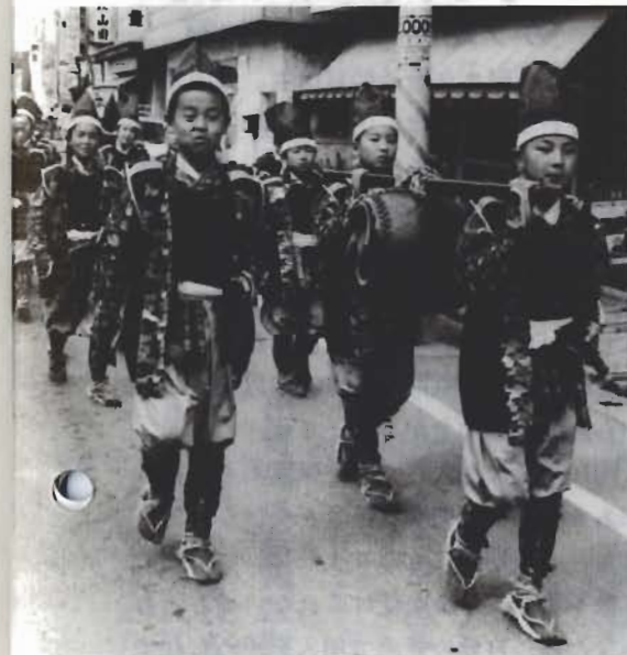
ヨロイ姿にふんし、行進する館山小の生徒

四月二十九日、ヨロイ姿の少年や腰元にくんした少女たち百十人が、市内を練り歩きました。これは、「里見氏最後の居城」で知られている城山公園の「つつじ祭り」を盛り上げる行事です。