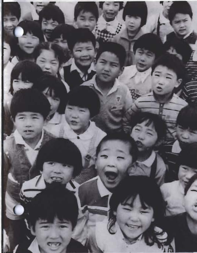
きみたちが生きるのは21世紀だ

両郡市の十五市町村が、国土庁から県内の、定住モデル地域に選ばれたのが昨年十月。二十