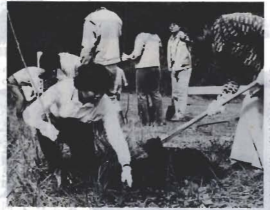
早く咲いて、と願いながら植えました

林道南条線の開通を記念する植樹式が、県南部林業事務所主催で、先月十七日に関係者百人を集めて現地で行われました。この道路は、総面積七十六ヘクタールの作名分取林内に県が計画し、