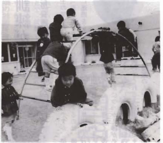
明るい園舎にはしゃぐ子供たち

九重保育園の新しい園舎が完成し、先月五日に竣(しゅん)工式を行いました。新園舎は、九重小学校の隣に、千三百五十平方メートルの敷地をもち、建て物はおよそ四百平方メートル、古い園舎の二倍近くも広くなり、「ゆつたりと子供たちをみられる」と保母さんたちも喜んでいました。