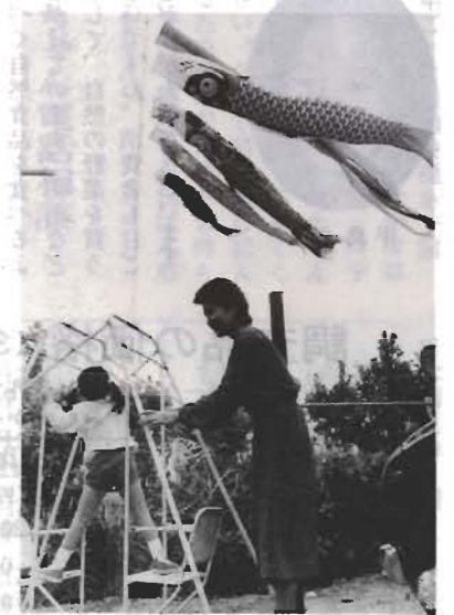
子供の健康を願うこいのぼり