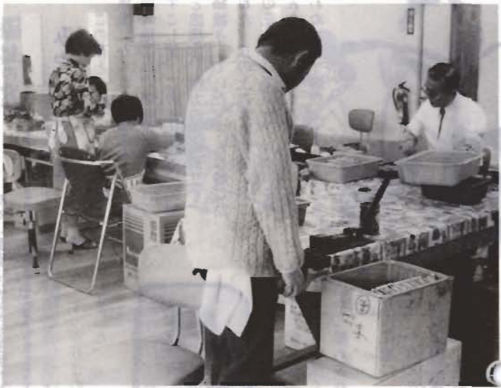
マジックペンの組み立て(上)や、七宝焼(4ページ左)に取り組み入所者。りっぱな作品(同右)もできました。

作業所に入って、お金の大切さを知った障害者がいます。七宝焼グループの作品を見て、「欲しい」といっただけで、所長が「これとこれとこれを買おうと、今月働いたお金が無くなるよ」と教えました。その後「サーカスが来ているから、見に行こうか」という話が出たとき、その障害者は「お金がもつたない」といっただけです。 家庭でも、それまでは、おつかいに行つても、持つてくるお