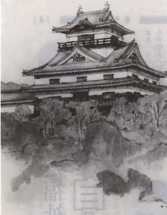
藤岡氏が描いた天守閣は3層4階建て

という博物館の機能が十分に発揮できなくなつては困ります。中途半端なものにするよりは、場所を離しても、本格的な博物館をつくりたい、と考えています。そうすれば、頂上は天守閣があつて、まわりの風景も眺められ、花見も楽しめる広場になります。