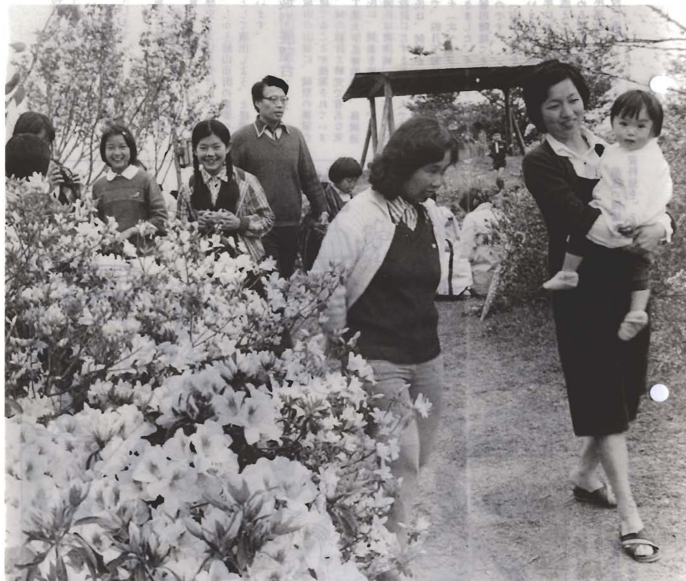
にぎわったツツジ祭り (4月27日、城山で)

■昭和55年5月号(毎月15日発行) ■No. 351 350 ■発行/館山市役所市長公室 ☎294 館山市北条1145-1 ■電話/2-3111