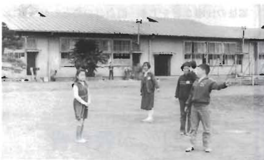
改築待たれる九重小