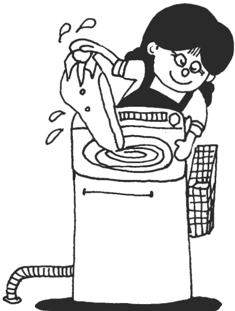
奥さん、洗剤の使いすぎは禁物ですよ

問い 海や川を、合成洗剤の汚染から守る対策はないか。 答え 汚染の原因はいろいろあるが、洗剤に含まれるリンが占める割合は大きい。市の施設は、三月一日から有リン洗剤を使わないことにした。ただ無リン洗剤は種類が少ない。粉