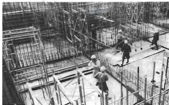
建設進む衛生センター

54年度に引き続いて、衛生センター(し尿処理場)を建設していきます。上水道は、出野尾、岡田、東長田、西長田の4地区に水道を給水する計画です。市内に、城山公園ほか5公園があります。それぞれの規模、内容に応じた整備を進めていきます。