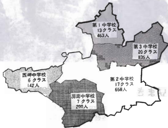
統合後の学区と学級数・生徒数 (55年4月推計)

房、第四の各中学校は、なくなりますが、昭和四十一年に学校統合審議会の答申が出て以来、統合を検討してきましたが、適当な用地がなく、具体的に進みませんでした。しかし、館山高校が昨年八月に高井地区に移転、その跡地が統合中学の用地に利用できることになりました。市教育委員会では、五十二年から対象となる地区の父兄と話し合いを重ね、父兄の同意が得られました。今年四月からの学区と生徒数は左の図のようになります。