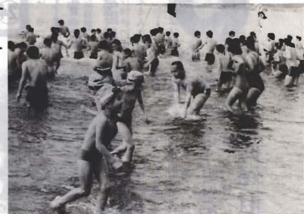
冷たい。思わずうしろ向き(1月19日)