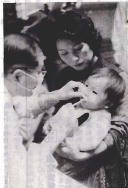
まだ、むし歯はないようです

一歳六か月児の健康診査を行います。一歳六か月ごろは、からだや心の発育に大事なときです。病気を早く見つけて指導し