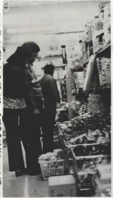
市では、インフレ下の市民の生活を守るため、次のような「市民運動」を提唱します。市民のみなさんご協力をお願いいたします。