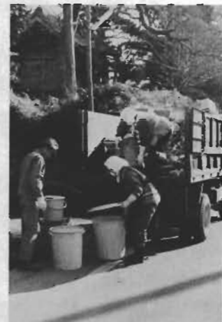
↑年末のゴミ量はふだんの2倍。

ことしもあとわずか。各家庭では、大そうじに忙しいことでしょう。昨年の暮に市で収集したゴミの量はふだんの二倍。限りある処理能力の中で、能率的なゴミ処理ができるよう、つぎのことにご協力ください。 ■年末のゴミ収集の最終日は、十二月二十九日(土)で、火・木・土と毎週土曜日の収集区域のみです。年始は一月四日から平常どおり収集します。必ず八時三十分までに所定の場所に出上は百・増すごとに五十円。 ■大そうじなどで出る大きなゴミはなるべく早目に出すようお願いいたします。 ■台所のゴミは水をよくきって出してください。 ■十二月三十日から一月三日までゴミ収集は休みますが、焼却作業は休みませんので、この間のゴミは正木処理場に直接お持ちください。百詰まで無料。それ以上は百・増すごとに五十円。