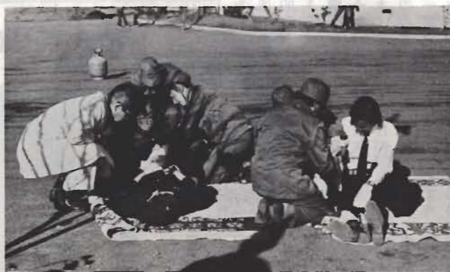
負傷者が医師の応急手当をうけ、毛布でつくった応急担架で救護所へ。