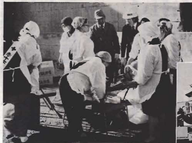
食糧供給訓練。罹災者に日赤奉仕団から非常用かんづめが手渡される。

▶ 家屋が倒壊し避難路をふさいだため、自衛隊のレッカー車が出動。障害物の除去を行なう。