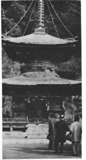
江戸時代につくられた多宝塔

那吉寺は市内の寺のうちでも小綱寺について古い由緒ある寺。正式には補陀落山普門坊千手院といひ、安房五大寺の一つ。境内一、七〇〇坪の中に、本堂、三重塔、鐘樓、地蔵堂、仁王門、阿彌陀堂、えんま堂などがあります。