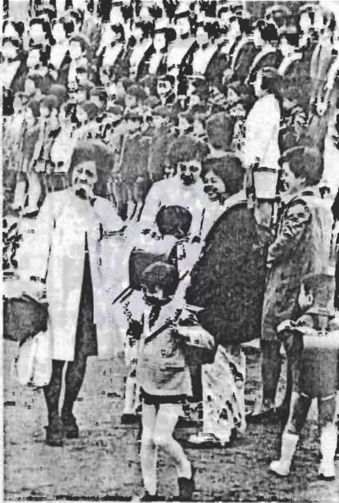
→春は入学シーズン。ことしの新入生は小学室が六四五人、中学生が八二一人。とくに小学校に入学した子たちは、このえうまの年に学んだ手たちで、毎年にくらべグッと少く、初余小の新入生はたった四人でした。