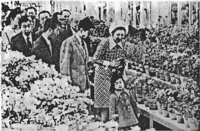
↑皇太子一家が三月二十三日ご来房、南房総の春を楽しみました。(写真は南房パラダイス)