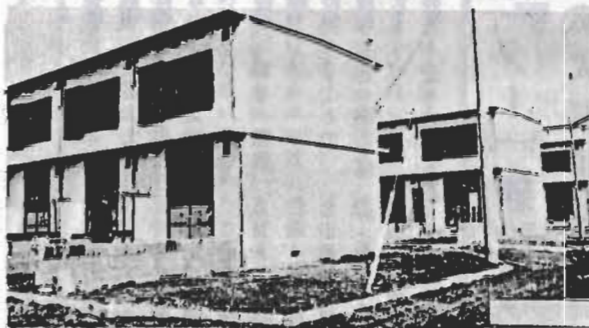
↑豊房の小学校校舎(二四八二平方)、中学校体育館(四〇八平方)、幼稚園(一八五平方)が完成しました。総工事費は一億一〇四万円。また、国分の豊野に建設中だった市営住宅(十六戸)もでき上りました。