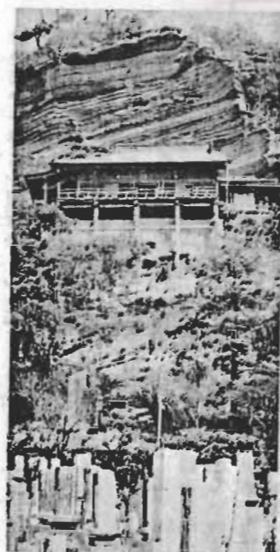
船形山の中腹 標高七十メートルの断がいに宙づりになったところからこの名が。真言宗智山派の船形山大福寺。

若潮国体の剣道競技は、ことし十月十五日から十七日まで三日間、館山市民センターで行なわれます。 剣道は日本古来の武道として数百年の歴史を持っています。はじめはただ戦いに勝つための武術でしたが、鉄砲の出現以来、心身の鍛錬を目的として行なわれるようになりました。 江戸時代、竹刀や防具が考案されてからスポーツ的な傾向を強めました。戦後、一時禁止されたが、昭和二十八年従来