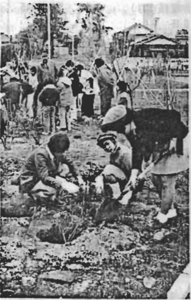
→三月二十一日、青少年植樹祭が中央公園で行なわれました。これには子供会、ボーイスカウトなど一五〇人が参加。市の木ツバキ、ツツジ、カイズカイブキなど約一五〇本を植えました。