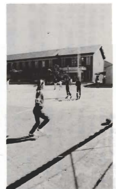
↑8月から防音校舎化される第二中学