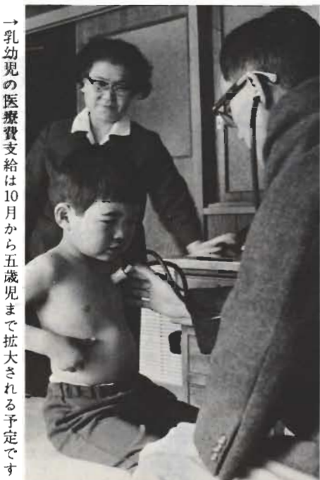
→乳幼児の医療費支給は10月から五歳児まで拡大される予定です

観光 国鉄内房線の複雑化と館山駅を中心とする商店街の近代化、西口の開設に努力する。 また、最近の乱開発から観光資源を守るため、開発企業への指導を高める。 商工業では、預託融資制度を改善し、新しく利用者への利子補給制を実施する。 農業 緑化推進のためカヤ山、ハゲ山などに松、桜を植える一方、市の木であるツバキを増植する。ほかに生鮮食料品の物価安定の一つとして、夏野菜の計画栽