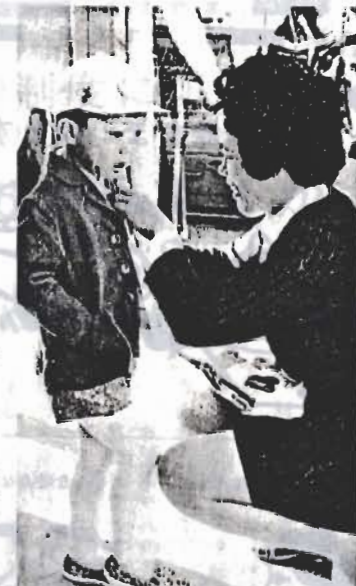
↑さる11月24日に行なわれた「一日入園」で

市では、幼児教育の重要性を 考え、十の幼稚園と五つの保育 園でみなさんのお子さんをおあ ずかりしています。 このうち市立幼稚園の昭和四 十八年入園児をつぎのように募 集します。基本的には五歳児に 優先して入園していただく方針 です。 申し込み用紙交付 来年一月