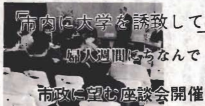
市内に大学を誘致して 婦人週間にちなんで 市政に望む座談会開催

利用料金は時間、使用する場所によりこまかにまわっていますので、直接センターにおたずねください。休館日は毎週火曜日と年末年始。使用には申込書が必要です。なおご利用のときは時間を守り、禁煙のところでタバコをすわないようお願いください。またセンターの敷地内に、体育施設として昭和四十五年七月に完成した弓道場があります。利用料金は、午前、午後、夜間単位で個人五十円（高校生は三十円）専用料金は午前六百元、午後八百円、夜間千円です。回数券十二枚つづりで五百円。市民センターと弓道場の利用については、市民センターの事務所（二一七〇二二）にお問合せください。