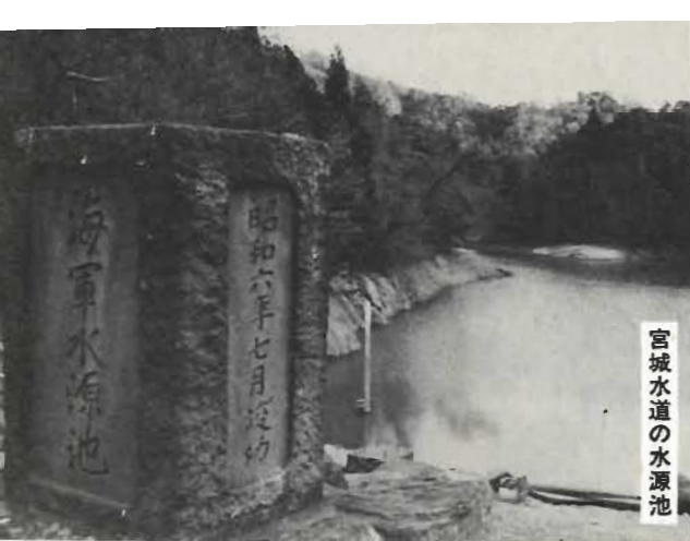
宮城水道の水源池

やはり水不足。毎年夏になると需要水量の増加にもない、一部地域に断水や時間給水がおり、市民のみなさんには大変ご迷惑をおかけします。 もともと水資源に乏しいわが市では、その多くを地下水と雨水に頼っているため、雨の少ない夏には水源が不足しがち。とくに西岬水道は、年間を通じて水道水の使用量の変動が最も大きく、観光客の増加などで夏の使用量は年々増え、急激な需要に追いつかず時間給水せざるを得ない実情です。 浄水場では自動装置が働かなくなるため、手動運転に切り替え夏の約一カ月は、職員二人一組になって毎日徹夜で勤務します。