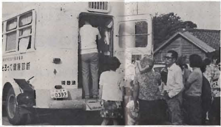
↑毎年夏に実施される住民検診

農業や漁業、自家営業の人など、ふだん家にいる人のために毎年、七月、八月に各地区で無料で行なっています。だれでも一年に一度は必ず受けるよう義務づけられています。住民検診ともよんでいます。