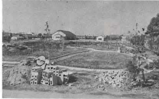
↑工事が進む中央公園

敷地は一・六ヘクタール 敷地に、花木園、野外ステージ、カなど、常緑樹や四季の花や木こんどできる公園は、一応北条中央公園という名称で呼ばれ、度中)噴水、児童コーナー、駐園を緑で埋める計画です。噴水車場、花壇、水呑み場(47年度)などが設けられます。 緑をいっばいに 公園の中央は、市民がいつきてもいこえる約三、八〇〇平方メートルの芝ふ広場。この中に音楽会やいろいろな集会に使われる屋根なしの野外ステージと、パーゴラ(テラス)、ベンチがつけられます。 また公園の周囲には、マテバシイ六十本、クス十五本、市の木ツバキ各種七十本をはじめ、サカキ、ヤツデ、アオキ、アジサイのほか、サツキ、ヤナギ、ジンチョウゲ、サザン