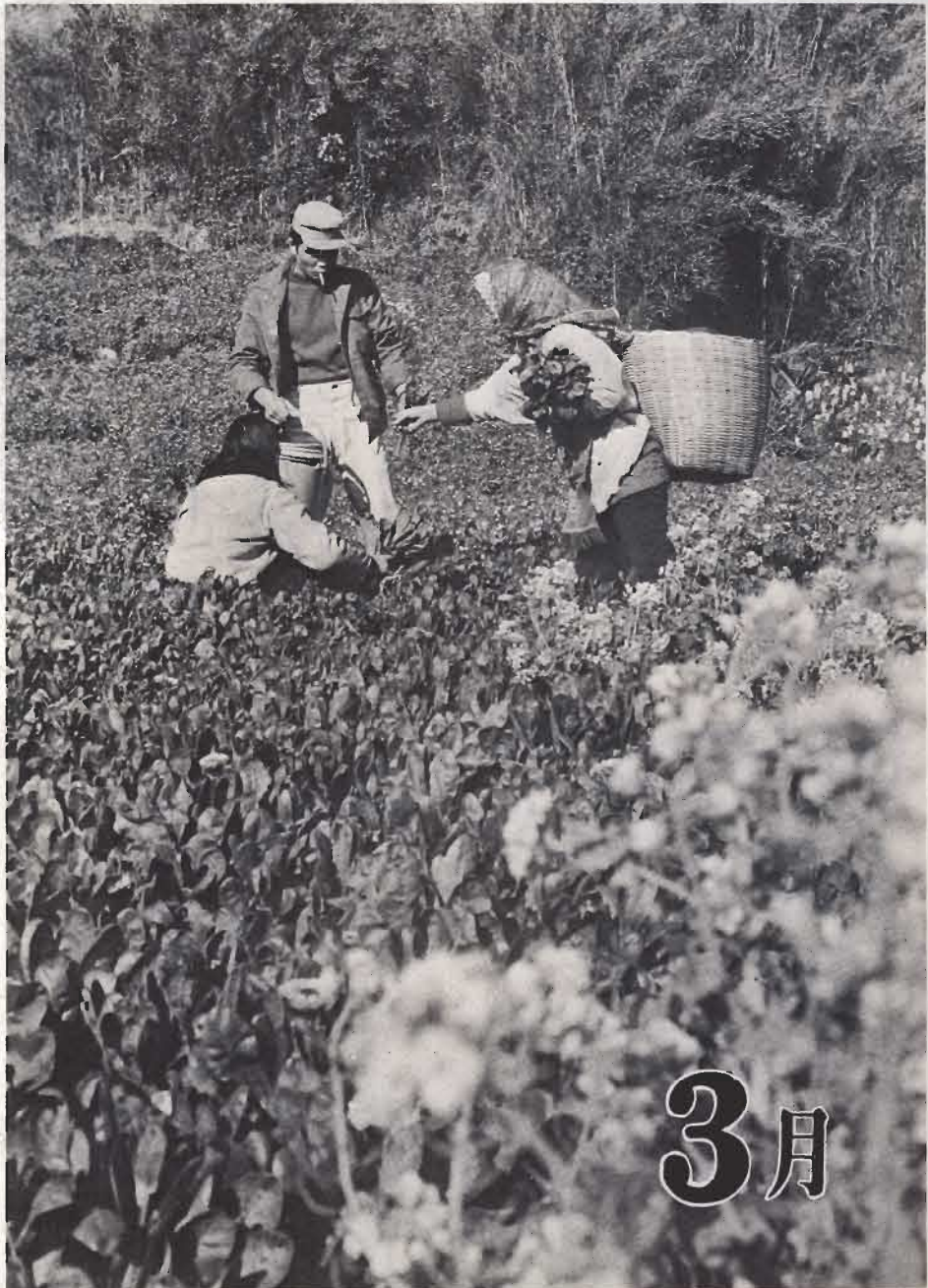
白波を立てた真つ青な海が、ないで暖かみを加え、のたりのたりとゆう長な感じになりました。春。花の季節です。ここは花どころの西岬。青い

■昭和47年3月号(毎月15日発行) ■発行/館山市役所 ■電話/☎ 3111(代表) ■No 252