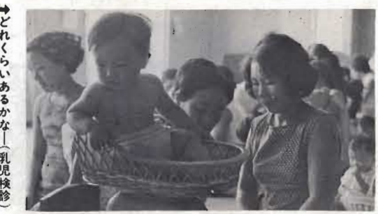
↑どれくらいあるかな(乳児検診)