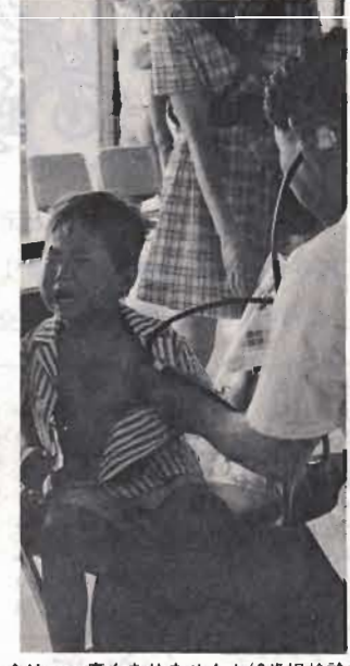
↑はい、痛くありませんよ(3歳児検診)

八月、九月、各地区で乳児検診といっしょに実施。無料。 三歳児は心身発達の上で極めて大切な時期で、早めに身体発育、精神発達の異常を発見し、適切な措置をとることが大切です。夜尿症や言語障害の問題をとくためことばの相談をしたり、