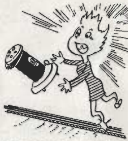
どこで つまづいたり、おとしたり?

火事するとき、最もたいせつなものは通報・消火・避難。最近では石油ふろがま、カスレンジなどが普通するのにもない、これらが普通するのにもない、これらの器具の取り扱いを誤り、火事がおこることが多くなっています。 消火もやはり初めが大事です。お宅にも、初期消火にいちばん有効な消火器をお備えください。次は代表的な火災原因と、取り扱ひ上の注意です。