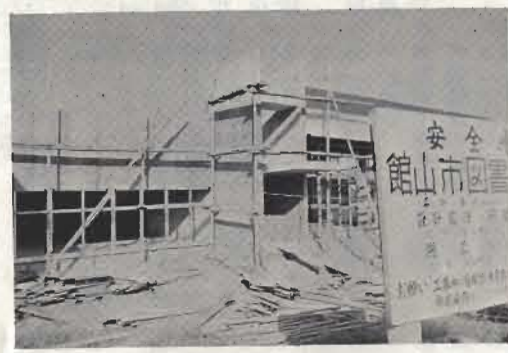
旧北条小跡地で順調に工事が進められていた市立図書館の新館は、12月には完成、来年はじめには開館の予定です。

「地方に住む主婦たちのくらしの相談相手に」と県消費生活センターのくらしの科学車が十月二十八日来館。家庭用品はどんなものを買えばよいか。食品添加物とは、など係のわかりやすい説明が訪れた主婦の間で好評でした。