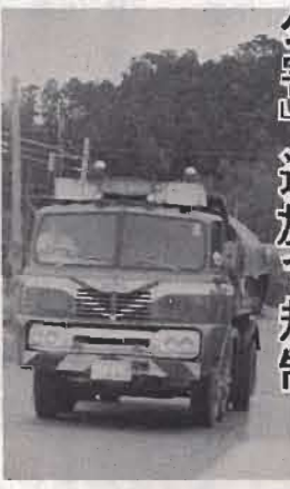
県や警察などの監督取締りを強化「土砂運搬適正化対策要綱」

「ダンプ公害」追放で規制 子どもが多い家庭の安定に少しでもお役に立てばと、市では昨年から第4子以上のおさんごのいる家庭に月千円をさし上げていますが、これとは別に来年1月から国の児童手当が施行され3月から支給されることになりました。 ■資格 5歳未満の子どもを含み、満18歳未満の子どもが3人以上いること。 ■所得の制限 前年の所得で決ります。家族構成によって違いますが、たとえば親子5人の世帯で、昭和45年中の所得が200万円以下であること。 ■手当の額 3人目の子どもから1人につき月額3千円。2月6月10月の年3回に分けて支給されます。(来年の第1回だけは3月)