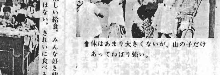
←楽しい給食。みんな好き嫌いはない。きれいに食べる。↑体はあまり大きくないが、山の子だけあってねばり強い。

青少年相談員さま 第四期の青少年相談員百十五名のみなさんがまじりました。これから三年間、青少年のために活躍していただきます。