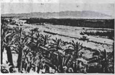
↑沿道に花が植えられる「フラワーライン」

九月定例議会が十七日から二十八日までの十一日間にわたって開かれました。審議されたのは、四十六年度の一般会計ほか三特別会計の補正予算はじめ議案七件報告一件です。 いずれも原案通り可決しました。