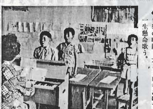
←音楽の時間。大きく口をあけて一生懸命歌う。

青少年相談員さま 第四期の青少年相談員百十五名のみなさんがまじりました。これから三年間、青少年のために活躍していただきます。