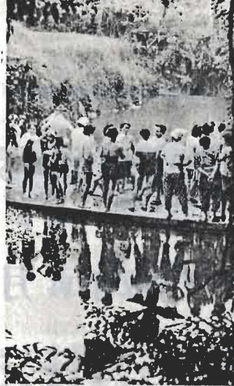
↑夏には近くの長尾川をせきとめたインスタントプールができる。

がんも早期に発見し、早期に治療すれば決して恐ろしいものではありません。あなた自身を守るため、おつくりがらずにぜひ