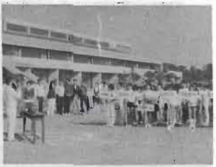
北条地区 入ボ一少大余

三年間の長い間、無報酬で子どもたち、青少年のため奉仕していただいた百六十二名の青少年ボランティアの愛の手紙運動を、花いっぱい運動、ボシドセメダイン利用防虫運動、オーボイ管楽器生みの愛の手紙運動などに、身をもって行動していた皆さま。ほんとうにごくろうさまでした。