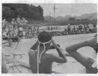
鯉房地区 父母と子どもの水泳大会

三年間の長い間、無報酬で子どもたち、青少年のため奉仕していただいた百六十二名の青少年ボランティアの愛の手紙運動を、花いっぱい運動、ボシドセメダイン利用防虫運動、オーボイ管楽器生みの愛の手紙運動などに、身をもって行動していた皆さま。ほんとうにごくろうさまでした。