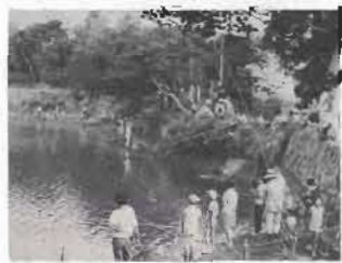
館野地区 青少年魚釣大会