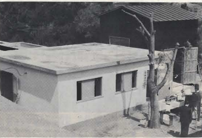
市営の畜舎の汚水浄化装置が完成しました。槽の構造は固形物分離機・貯留槽・沈んでんなどからなり、一日約120トンの汚水を処理します。工事費は1490万円。公害防止の見地からこの装置の果たす役割は大きなものになるでしょう。