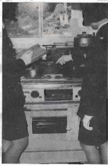
各家庭をまわって防火診断をする女性消防士