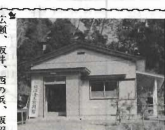
城山公園に「施設と市民憲章を大切に」と書かれた立て札がたてられました。館山地区青少年相談員のかたがたによるものです。

第三回のあすを築く青少年のつどいは、昨年十二月十一日市民センターで行なわれました。今回はとくに市内小中学校の女生徒だけ千人が、作文を発表したり、グループ別に「愛と友情」をテーマに話しあいました。