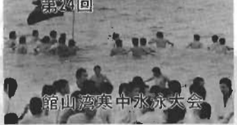
館山湾寒中水泳大会

ねずみ、ゴキブリは赤痢や食中毒など各種の疾病をばらばらと、公衆衛生上大きな被害を与えています。この駆除は、各家庭でやるより市内いっせいに町内ぐるみで実施する方が効果があります。 市では、「市内いっせいにねずみ、ゴキブリ駆除運動」を行います。実施期間：二月、二月 殺虫剤の使い方 殺虫剤の使い方 殺虫剤の使い方 殺虫剤の使い方 殺虫剤の使い方 殺虫剤の使い方 殺虫剤の使い方 殺虫剤の使い方 殺虫剤の使い方 殺虫剤の使い方 殺虫剤の使い方 殺虫剤の使い方