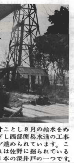
水工事をめぐる。給水管の工事。水を引くための深井戸が掘られて、水が引かれました。今後はとくに市内に話したいをしました。

国民年金加入のおすすめ サラリーマンの奥さんでも希望があれば国民年金に加入できます。奥さんはご主人の厚生年金や共済組合によって、うちの保障はされていますが、この保障はご主人の廃疾、死亡、老令という事実に対してです。ですから、奥さんが年をとっても、また不慮の事故や病気で障害者になった場合でも、ご主人の年金からの保障はありません。