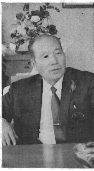
館山市長 本間 譲

館山市建設のため、誠心誠意努力してまいりました。今後四年間も、私心を離れ、市民に奉仕をモットーに、市勢発展に渾身の努力を傾けてまいります。 昭和三十七年に市政を担当して以来八年間、私は教育、産業、観光の三本の柱のもとに、明るく住みよい豊かな大