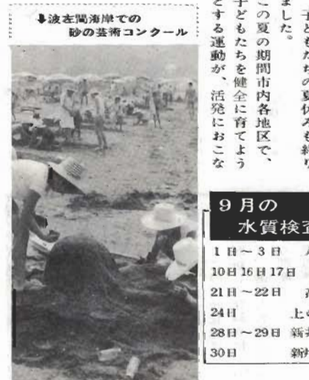
波左間海岸での砂の芸術コンクール