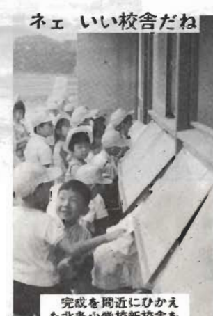
完成を間近にひかえた北条小学校新校舎。1年生がこまごま入校している。