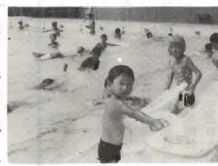
完成したばかりのプールで泳ぐ那古小のよい子