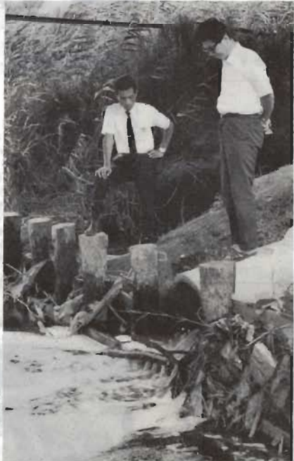
香川に流される汚水は魚を死なせ悪臭を出して海をよごします

「公害」ということが出ない日はないほど、公害は大きな社会問題になっています。人間の健康といのちをむしばむ公害は、なにも京葉京浜などの工業地域だけで