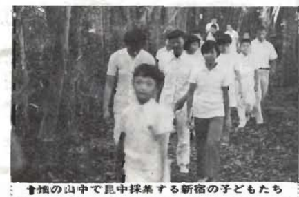
會社の山中で昆虫採集する新宿の子どもたち