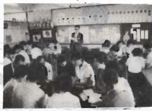
家庭教育学級は、両親

子どもの性格は三才までの生活で定まるといわれます。変化の激しい時代に生きる親は、子どもをどのように育てたらよいでしょうか。七周年を迎えた家庭教育学級をご紹介します。