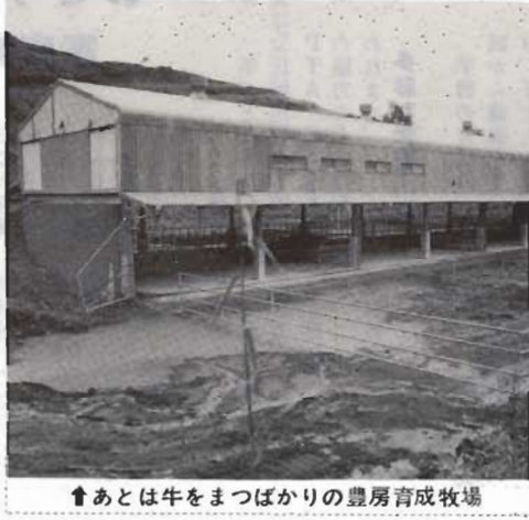
↑あとは牛をまつばかりの豊房育成牧場