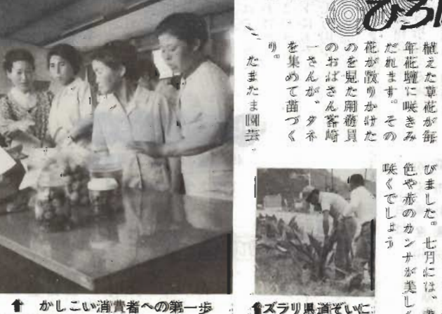
↑ かしこい消費者への第一歩