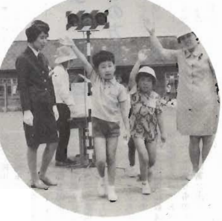
↑手をあげて泳ぐよい子に笑顔で止まれ

家庭教育学の大切さ 実際に参加した学級生の中からは、「人前で話すときは、いそぎを知らず、緊張がかりだつたが、学級をつづけていくうちに気にならなくなつた」とか、「親同志で子どものことを話しあうことが多くなつた」とか、「家庭教育的な声があがっています」とか、父親の出席が少なくない