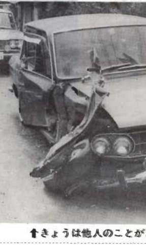
↑きょうは他人のことがあすはわが身に

たばこは市内の買値は、おにいちゃんにきび、おにいちゃんにきび、おにいちゃんにきび。