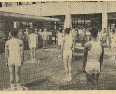
(市役所前で市長の激励を受けるランナー)

本市では、一般行政職の採用試験を次に行ないます。 一、受験資格 昭和15年4月2日より昭和23年4月1日までに生れた者で、学歴は問いません。 二、受付期間 昭和40年10月13日から10月31日まで。 三、試験期日 11月14日(日) 四、受験手続 申込用紙は市役所秘書課で交付します。申込書に必要な事項を記入し、秘書課に提出してください。 詳細は市役所秘書課に問い合せください。