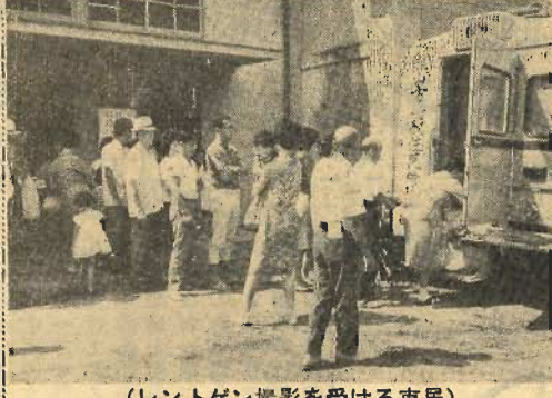
(レントゲン撮影を受ける市民)

健康で文化的な生活を営む権利を憲法はうたっており、結核予防法では毎年一回定期的に健康診断を受けなければならぬと定めております。