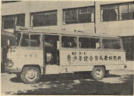
青少年健全育成条例施行の巡回バス

★条例の主な内容は★ 一、青少年によい映画、よい本等をすすめること。 二、青少年に悪い映画、悪い本等をみせたり読ませたりしないようにしよう。 三、青少年にふさわしくない用具、刃物等は持たせないようにしよう。 四、青少年にふさわしくない場所へ出かけることを禁止しよう。 五、青少年に悪い広告物を掲示しないようにしよう。 六、青少年に悪い映画、悪い本等をみせたり読ませたりしないようにしよう。 七、青少年に悪い映画、悪い本等をみせたり読ませたりしないようにしよう。 八、青少年に悪い映画、悪い本等をみせたり読ませたりしないようにしよう。 九、青少年に悪い映画、悪い本等をみせたり読ませたりしないようにしよう。 十、青少年に悪い映画、悪い本等をみせたり読ませたりしないようにしよう。