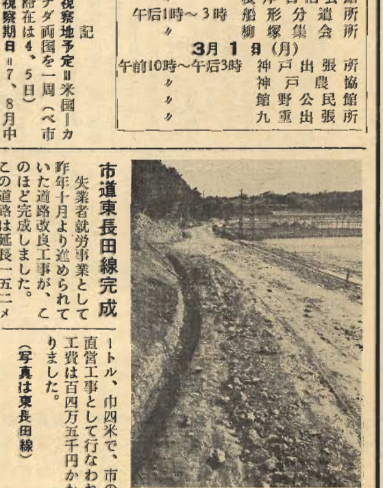
市道東長田線完成

一中技術家庭科室増築工事 技術教育は、中学時代が最もたいせつだといわれております。今まで狭い教室に悩まされていた館山第一中学校の技術家庭科室が、三月竣工予定で増築をすすめております。技術科室は木造平家建77.15坪、家庭科室は木造平家建35.07坪で工費450万円をかけております。