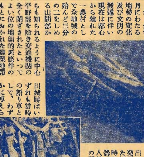
出野尾に発掘された古墳の出土品。御開帳の最後にはいまひとつ紹介したいことは、所が三箇所(二十八番神余寺(神余)、三十二番小網寺(出野尾)、三十三番杉本寺(西長田))があり御開帳の年には巡禮にまわる善男善女の参詣とをたえず、そのなかで小網寺の釣鐘はその銘等が浮彫りになつていて、その鐘造りが古来よりあり、その作は遠くわ安九年前七百年前といわれ、近く縣文化財として又國寶指定として申請中のものである。 以上極めておまかなな素描であるが、學術的にも經濟的にもますます重要な性を増しつつある豊房は、今後文化の向上と地理的條件の打破と相まつて、その將來をいよいよ期待されるべきところである。

火事と電話で云えば 消防署に電話が今通線の場合には發生の場所を知らせる限り正確に知らせて下さい。 早期発見は人命財産を火災から守ります。