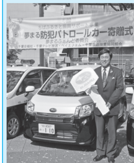
▲寄贈された防犯パトロールカー

10月30日、「夢まる防犯パトロールカー寄贈式」が千葉市で行われ、館山市を含めた県内5市区町に防犯パトロールカー(通称「青パト」)が寄贈されました。