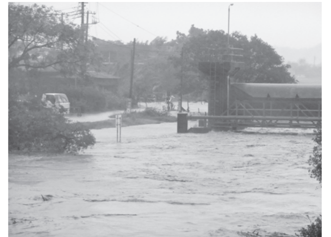
▲台風 26 号の大雨による平久里川の増水 (平成 25 年 10 月 16 日 平成橋付近)

命を守るには、避難などの行動を自分自身で行うことが基本となります。市では、危機が迫っている際に、市民の皆さんに避難行動を促す「避難広報」を行います。そのタイミングやとるべき行動についてあらためてお知らせします。