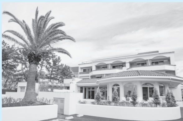
▲「なのはな館 なぎさ」の施設外観

11月16日、市内北条に安房地域で初めてとなる「サテライト型小規模介護老人保健施設 なのはな館 なぎさ」が開所しました。