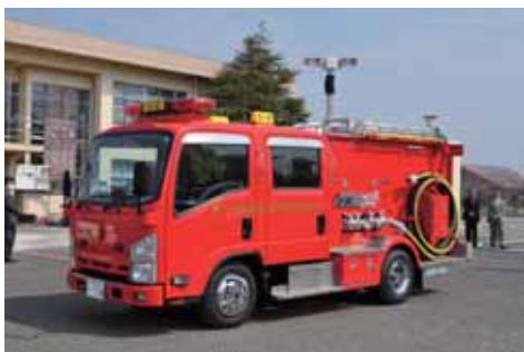
▲貸与された消防ポンプ自動車