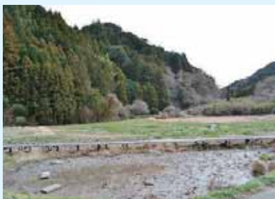
▲五十蔵の山（奥は黒滝川）

里見家に関する伝承の中には戦乱に翻弄される女性たちの話があります。今回紹介する倉女は、里見義豊の妻となった女性です。義豊は、安房里見氏の嫡流でしたが、天文3年（1534）4月、天文の内乱で分家の里見義堯に滅ぼさ