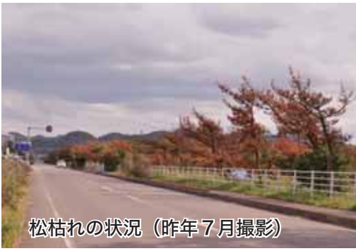
松枯れの状況（昨年7月撮影）

平砂浦海岸は、約5kmにわたり砂浜が弓なりに続き、松林が連なる四季折々の自然のコントラストが美しい、南房総最大の海岸です。海岸には、ハマヒルガオなど海岸特有の植物が自生しています。また、平砂浦海岸は、「日本の道100選」に選定されている房総フラワールラインがあり、白い砂と青々とした松により形成され、日本の美しい海岸の風景としてたとえられる「白砂青松100選」に選定されています。