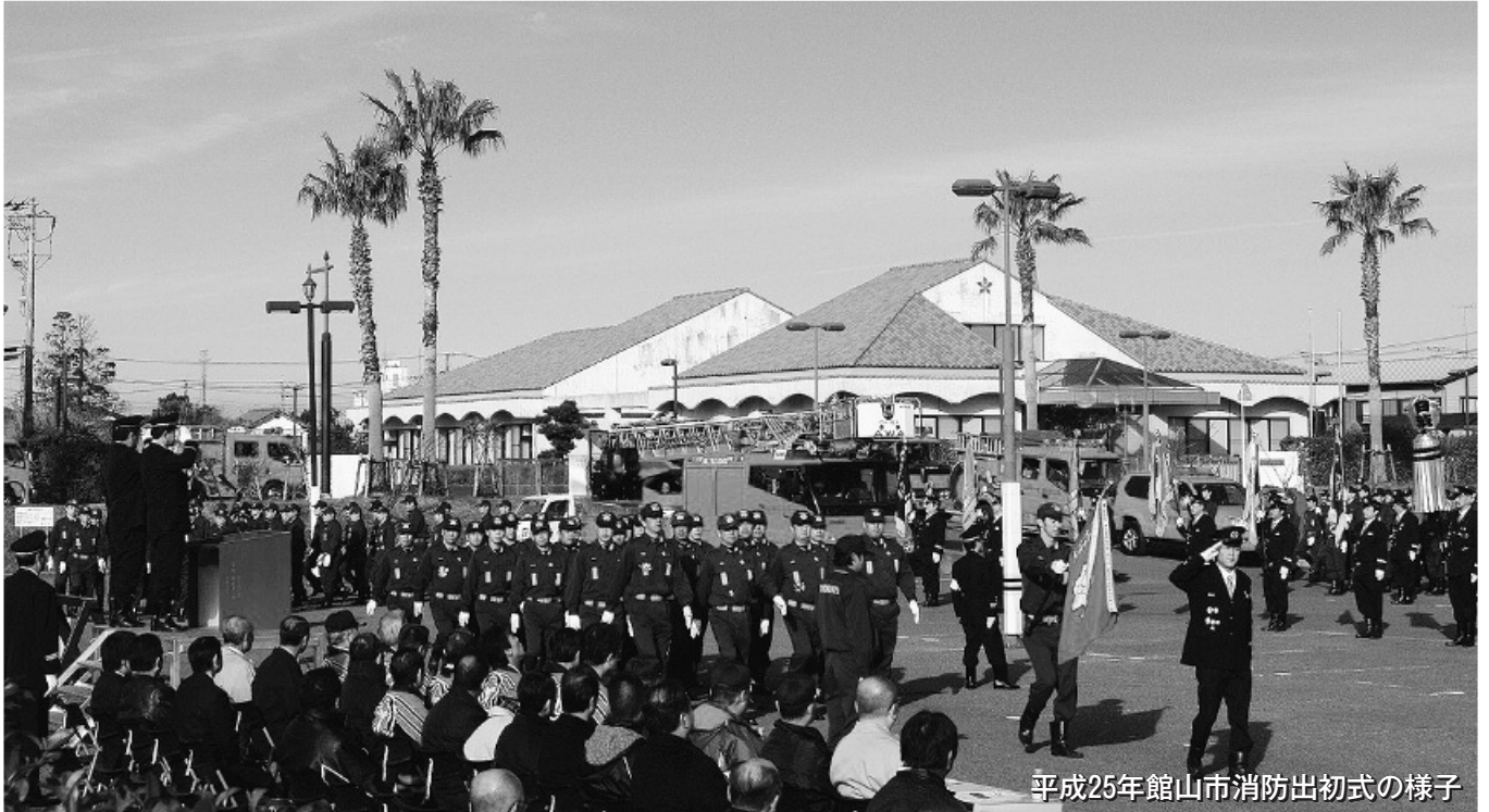
平成25年館山市消防出初式の様子

●平成25年2月号 ●No.100 ●発行/館山市議会 ●☎294-8601 館山市北条1145-1 ●電話 0470-22-3527 議会メールアドレス gikai.j@city.tateyama.chiba.jp