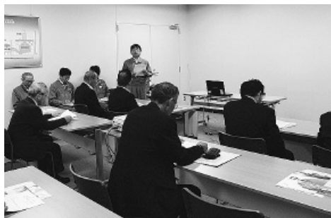
建設経済委員会の視察の様子

条例・通勤定期利用支援金事業・自主防災組織・防災対策専門員・空き家等の適正管理に関する条例