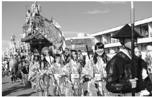
南総里見まつりの様子

きな効果があったと考えます。宿泊についても、南総里見まつりを目当てに宿泊したお客様も多かったと宿泊業者の方から伺っています。