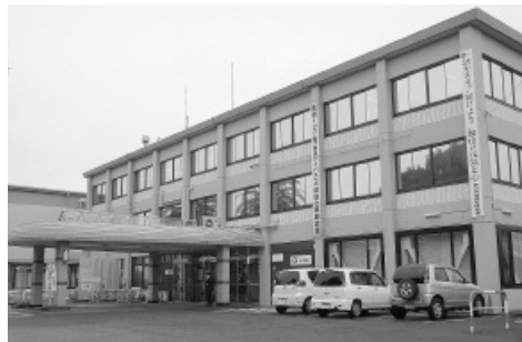
耐震改修工事後の市役所の外観

務棟)耐震改修工事については、白幡興業株式会社と工事請負契約を締結したが、施工に際し、既存コンクリートブロック壁の鉄筋が柱・梁に十分に定着されていなかったことが判明し、新たに補強工事が必要となったため契約金額を213万7800円増額し、2億268万7800円に変更しようとするもの。