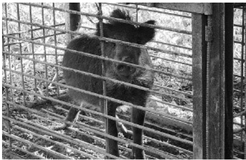
市内正木地区にて捕獲されたイノシシ

また、スクールバス等の運行に係る借上料及び委託料の債務負担行為について、今後の推移を聞いたところ、房南地区で検討されている小中一貫校の再編に伴い大規模な見直しを行っている。当面は現行どおり運行を考えており、年間2500万円程度の支出が見込まれる、との説明がありました。