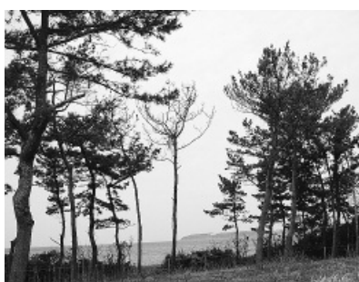
松くい虫の被害状況

主要事項として地域おこし協力隊に係る隊員の支援業務委託費、自立支援医療費、障害介護給付費、私立の認可保育園などへの入所児童の増加による運営委託料、松くい虫防除事業、平砂浦砂防林の再生を図るための平砂浦植林事業、北条小学校耐震改修事業、経年劣化した館山城外壁の修繕などを行う博物館修繕事業など。