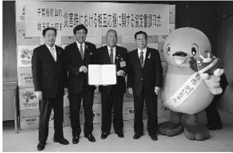
三郷市との調印式

今後も防災対策に関し、お互いの意見交換も含め、相互応援体制を築きたいと考えています。