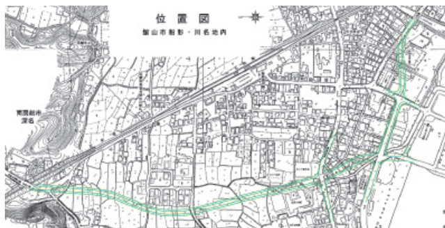
船形バイパス (色ライン 道路計画線)

受け、その後用地取得を開始していく予定です。本事業の完成年度は、現段階では、平成33年度を見込んでいます。