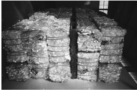
処理後のペットボトル