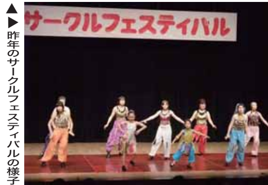
▲ 昨年のサークルフェスティバルの様子

ルなどの発表があります。2日（土）・3日（日）には、コミュニティセンター内に、注目の新スポーツ『スポーツ吹矢』の体験コーナーも設置されます。ぜひ、お出かけください。 日時 ／3月2日（土）～4日（月） 午前10時～午後5時（4日は正午まで） 会場 ／コミュニティセンター、南総文化ホール小ホール（4日のみ） 問合せ ／中央公民館（☎23-3111）