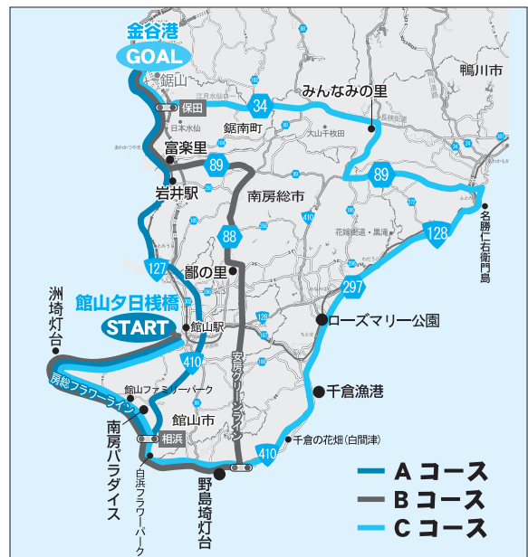
▲「房総半島クルーズと春の南房総サイクリング」のコース

問合せ ／東京湾フェリー「房総半島クルーズと春の南房総サイクリング」係（☎046-830-5622）