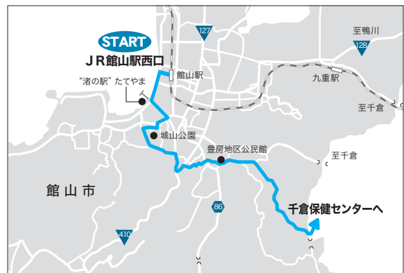
▲「南房総フラワーマーチ（館山・千倉田園コース）」のコース概要

自転車も車両です。自転車でも交通ルールに違反すると、罰金などの処分を受ける場合があります。ルールを守って自転車を利用しましょう。問合せ／社会安全課（☎22-3142）