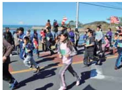
▲ファミリーの部の皆さん

「去年から参加していて、楽しみにしていました。これを目標に、ときどき運動しています」「楽しかった。去年より少し速かったので良かったです」