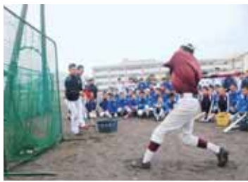
▲プロ野球選手に指導を受ける 市内中学校野球部員

プロ野球選手の貴重なシートノックを受けた後のティー打撃では、「打撃も下半身の安定が大切