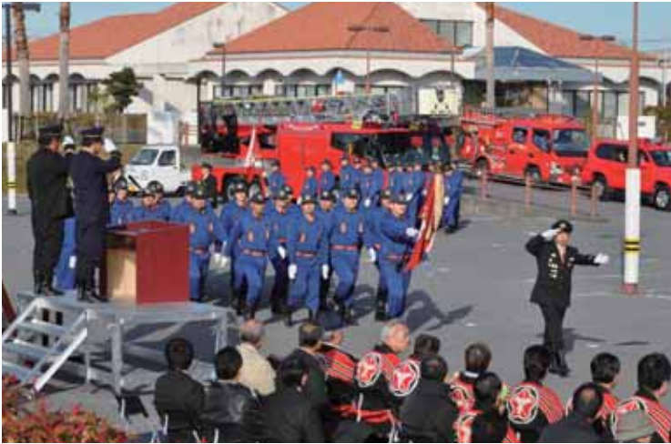
▲団員と消防自動車の入場行進

新春恒例の館山市消防出初式が先月6日、コミュニティセンター第1駐車場と南総文化ホールで挙行されました。会場には市内の消防団が一同に集まり、部隊分列行進や実践式操法訓練などを次々に披露し、防災への意識を新たにしました。また、地域防災に尽力された功労者107人が表彰されました。 問合せ／社会安全課（☎22-3442）